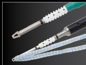
SwiveLock® kotvy 4,75 mm a 3,5 mm spolu s FiberTape® páskou.